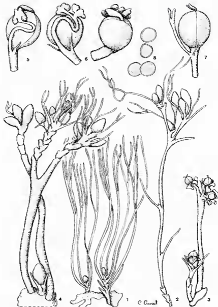
Pl. 3. — Letestuella tisserantii G. Tayl. ; 1, 2, 3, plante en fleur \times 3 ; 4, plante portant de jeunes fleurs \times 5 ; 5, fleur jeune unistaminée dégagée de la spathe \times 14 ; 6, fleur jeune dégagée de la spathe, à 2 étamines \times 14 ; 7, fleur âgée, les étamines sont tombées \times 14 ; 8, pollen. (1, Giess 9366; 2, Tisserant 2352; 3, 4, Exell & Mendonça 2701; 5, 6, 7, A. de Menezes 2136).